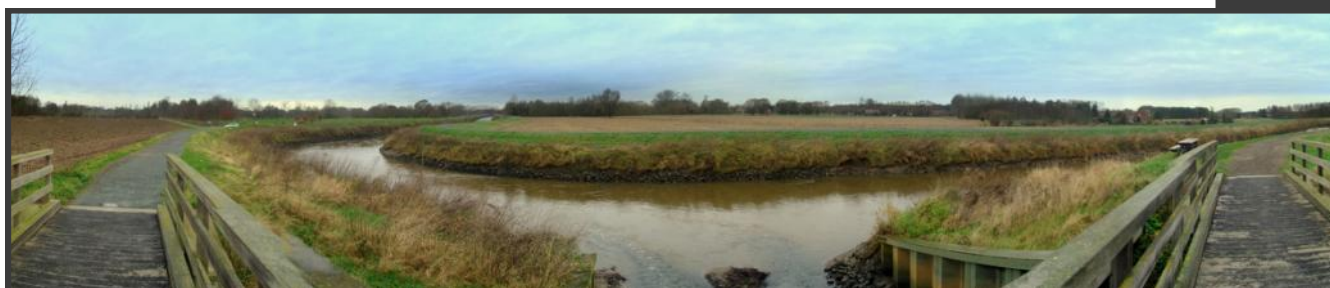
Panorama van de monding van de Weesbeek in de Dijle, Boortmeerbeek

“Op de Rondetafel worden de problemen rond waterkwaliteit en –kwantiteit in het bekken besproken”