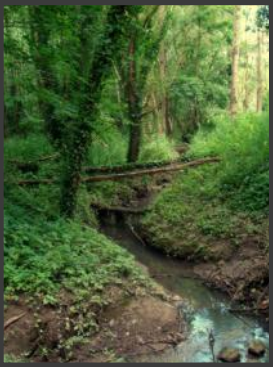
De Weesbeek in het Silsombos, Kortenberg