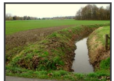
Aanleg van een bufferstrook langs de Leibeek, Kampenhout

In 2010 zullen ook op andere plaatsen landbouwers gepolst worden voor het afsluiten van nieuwe beheerovereenkomsten.