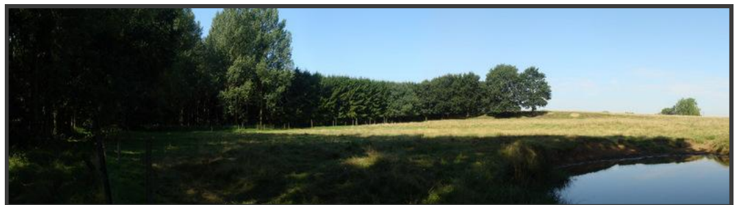
Panorama met bos, weide en pool, Kortenberg